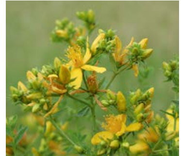
Johanniskraut ist anspruchslos und wächst bei uns auf Wiesen und am Wegesrand.

Das Johanniskraut ist in vielerlei Hinsicht mit Licht und Sonne verbunden: Wenn die Tage im Juni am längsten sind, beginnen sich seine Blüten, die wie kleine Sonnen aussehen, zu öffnen. Kein Wunder also, dass diese Pflanze Sonne in dunkle Gemüter bringt. Die stimmungsaufhellende Wirkung des Johanniskrauts schätzt man auch in der chinesischen Medizin – neben vielen anderen positiven Effekten.