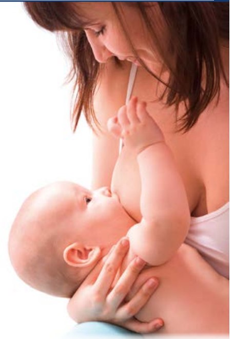
Stillen ist für Mutter und Kind die optimale Ernährungsform.

Stillen steht für die innige Verbindung zwischen Mutter und Kind. Doch wenn die Milch sich staut oder gar eine Mastitis, eine Entzündung der Brust entsteht, kann es zum Albtraum werden. Medikamente helfen hier zuverlässig, die Wirkstoffe können jedoch das Baby belasten. Besser sind deshalb schonende Maßnahmen wie beispielsweise Akupunktur.